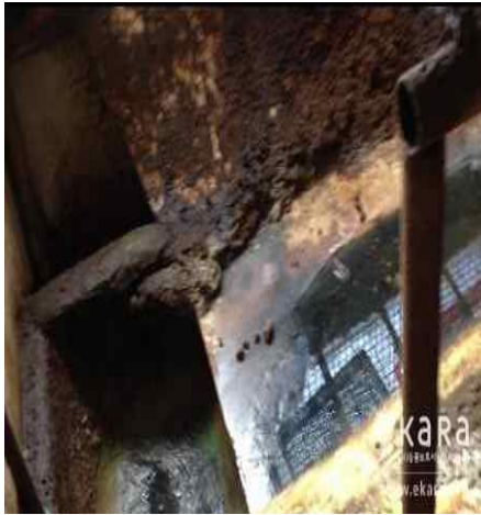
[사진41]상무농장 분변처리 상황