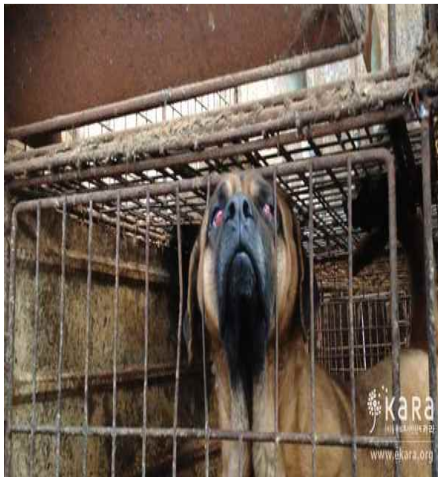
[사진20]만복농장 눈병든 개