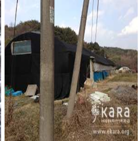
[사진27]부산기장군농장1 전경 1