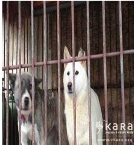
[사진2]마포사슴농장 인근농장의 귀 뜯겨진 개