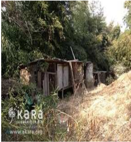
[사진32]동산농장 외부 폐건사