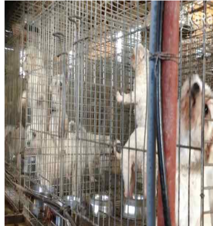
[사진25]선경애견 내부 견사