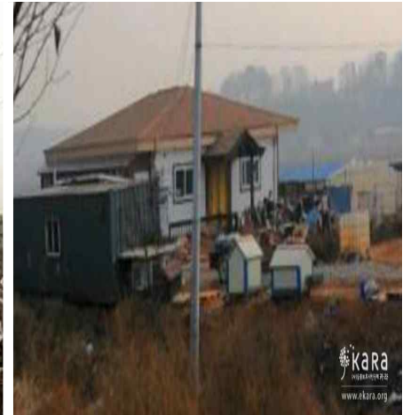
[사진19]카센터 농장 외부 3