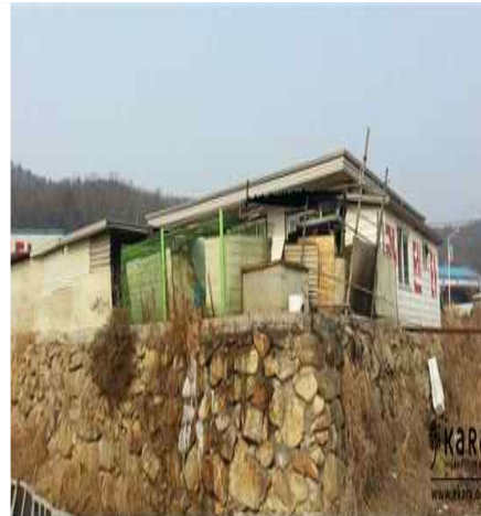
[사진17]카센터 농장 외부 1