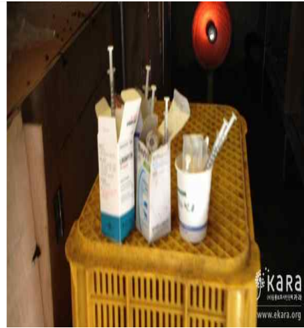
[사진42]상무농장 약품 사용