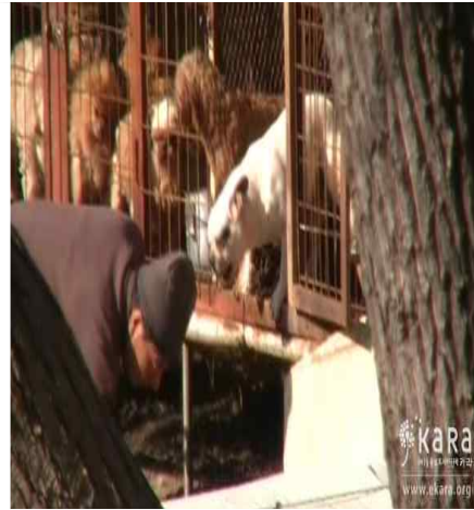
[사진35]반이농장 견사 2