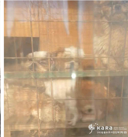
[사진11]유현리 견사와 개들