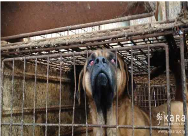
사진설명 : 김포시 미신고 불법번식장 <만복농장>의 개. 물도 먹이도 전혀 없는 상태에서 악취와 불결한 환경으로 눈에 질병을 앓고 있다.