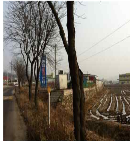
[사진18]카센터 농장 외부 2