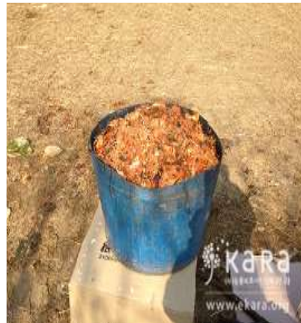
[사진39]양산시농장견사 앞 짬밥