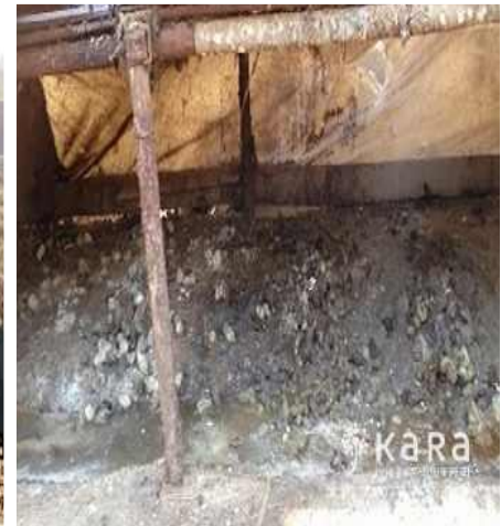
[사진23]만복농장 분변 방치