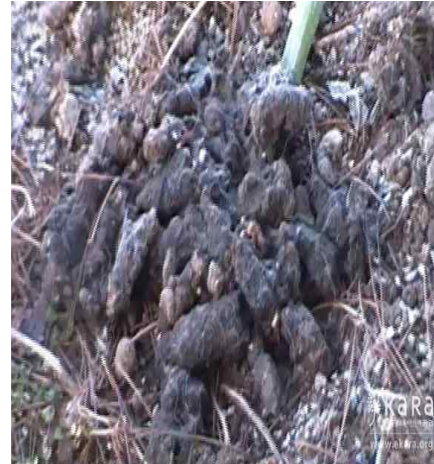
[사진26] 선경애견 분변방치