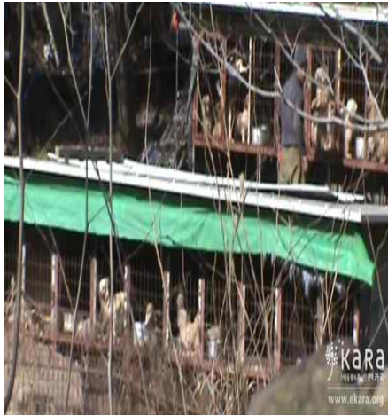
[사진34]반이농장 견사 1