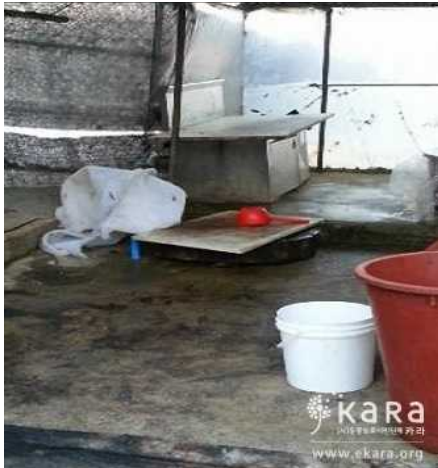
[사진1]마포사슴농장 인근농장의 마와 칼갈이