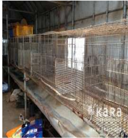
[사진33]동산농장 내부 폐건사