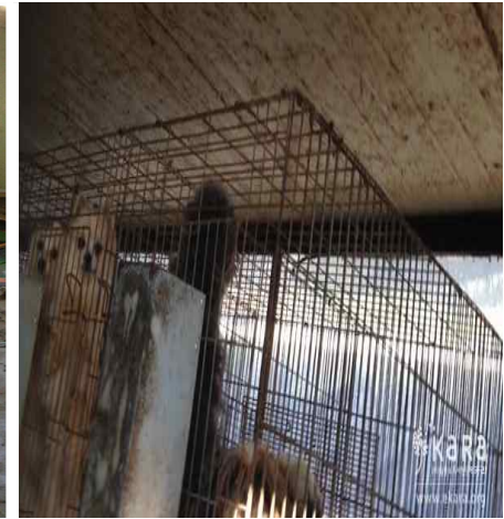
[사진44]상무농장 내부 견사 2