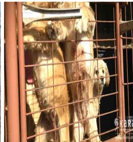
[사진14]한성켄넬 모견 늘어진 배