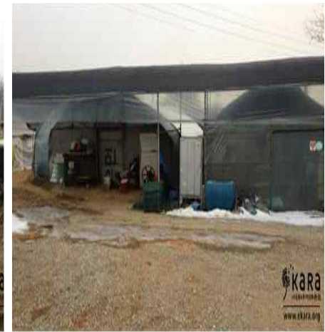
[사진8]주교동 농장 외관