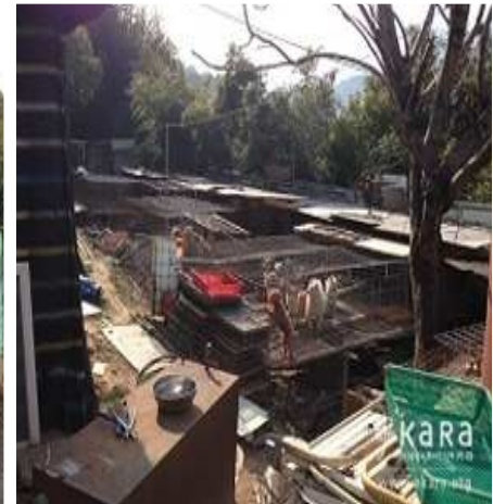
[사진31]동산농장 견사와 개들