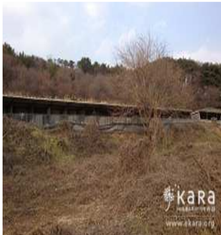
[사진28]부산기장군농장1 전경 2