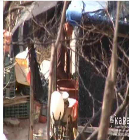
[사진36]반이농장 급여 모습