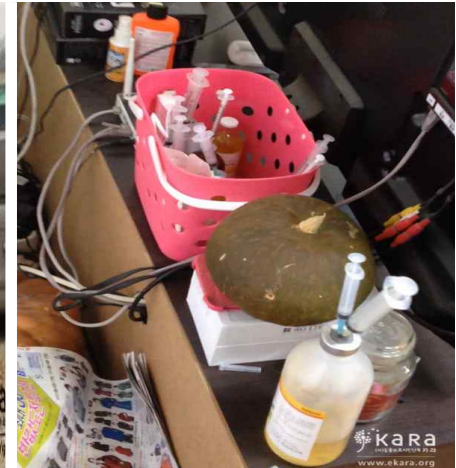
[사진4]유토피아 인근농장 약물