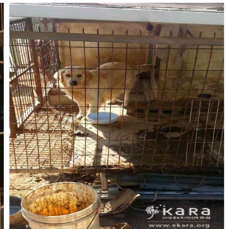
[사진15]한성켄넬 외부 대형견