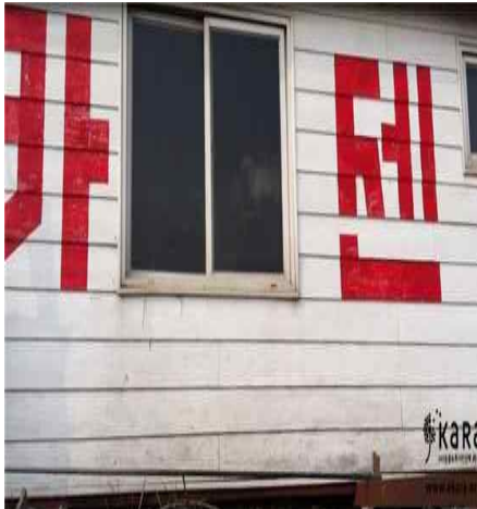
[사진16]카센터 농장 내부의 개