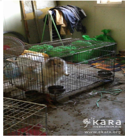
[사진43]상무농장 내부 견사 1