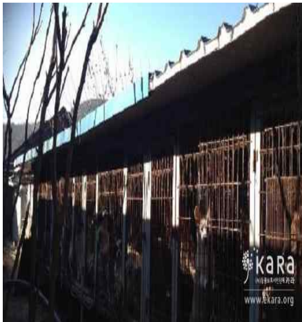
[사진45]상무농장 외부 견사